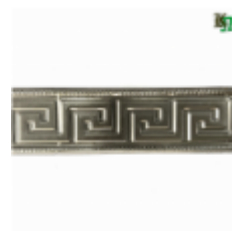
Декоративный прокат, полоса, арт. 412.26 2500х80х1мм Вес: 1.37 кг Цена (за штуку): 650 руб.