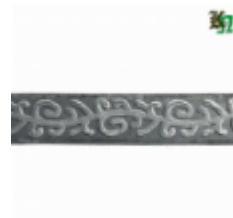
Полоса, арт. 20404П 3000x20x4мм Вес: 2.17 кг Цена (за штуку): 320 руб.