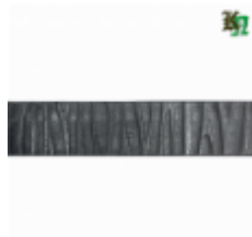
Полоса, арт. 20403П 3000x20x4мм Вес: 2.17 кг Цена (за штуку): 320 руб.