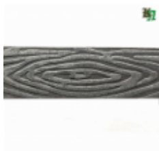
Полоса, арт. 40409П 3000x40x4мм Вес: 4.3 кг Цена (за штуку): 380 руб.