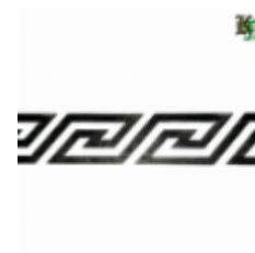
Декоративный прокат, полоса, арт. 820 1200х95х2.5мм Вес: 1.2 кг Цена (за штуку): 480 руб.