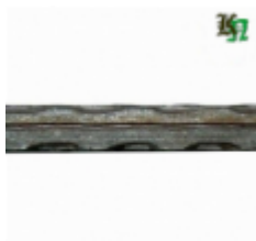
Квадрат, арт. 12Д2 3000мм, кв.12x12мм Вес: 3.43 кг Цена (за штуку): 480 руб.