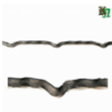
Квадрат для решетки, обжатый, арт. 179 1900мм, кв.10х10мм Вес: 1.5 кг Цена (за штуку): 350 руб.