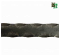
Полоса, арт. 25401П 3000x25x4 Вес: 2.4 кг Цена (за штуку): 330 руб.