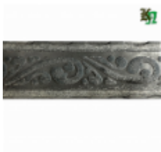
Полоса, арт. 50507П 3000x50x5мм Вес: 5 кг Цена (за штуку): 570 руб.