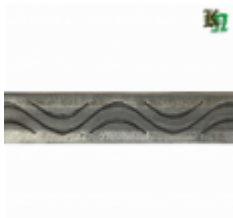
Полоса, арт. 20401П 3000x20x4мм Вес: 2.17 кг Цена (за штуку): 320 руб.