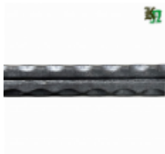
Полоса, арт. 12602П 3000x12x6мм Вес: 1.7 кг Цена (за штуку): 270 руб.