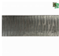
Полоса, арт. 50511П 3000x50x5мм Вес: 5 кг Цена (за штуку): 570 руб.