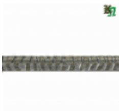
Квадрат, арт. 12Д3 3000мм, кв.12x12мм Вес: 3.43 кг Цена (за штуку): 480 руб.