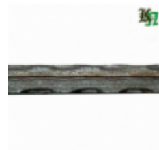
Квадрат, арт. 10Д2 3000мм, кв.10x10мм Вес: 2.38 кг Цена (за штуку): 300 руб.