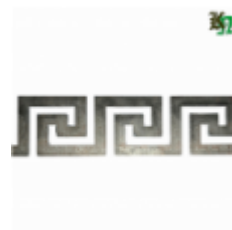
Декоративный прокат, полоса, арт. 827 1200х95х2мм Вес: 1.2 кг Цена (за штуку): 550 руб.