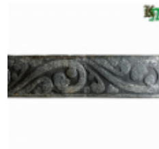
Полоса, арт. 30407П 3000x30x4мм Вес: 2.8 кг Цена (за штуку): 385 руб.