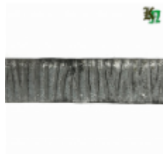
Полоса, арт. 30411П 3000x30x4мм Вес: 2.8 кг Цена (за штуку): 385 руб.