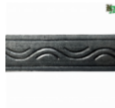
Полоса, арт. 40406П 3000x40x4мм Вес: 4.3 кг Цена (за штуку): 465 руб.