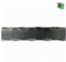
Полоса, арт. 20402П 2930x20x4 Вес: 2.2 кг Цена (за штуку): 320 руб.