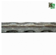
Квадрат, арт. 16Д2 3000мм, кв.16х16мм Вес: 5.85 кг Цена (за штуку): 1 000 руб.