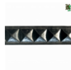
Полоса, арт. 32901П 3000х32х9мм Вес: 3.35 кг нет в наличии