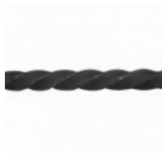
Квадрат, арт. 12Д4 3000мм, кв.12x12мм Вес: 3.45 кг Цена (за штуку): 615 руб.