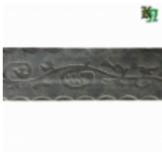
Полоса, арт. 40404П 3000x40x4мм Вес: 4.3 кг Цена (за штуку): 465 руб.