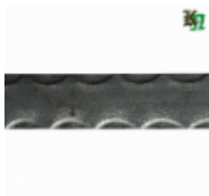
Полоса, арт. 30401П 3000x30x4мм Вес: 2.8 кг Цена (за штуку): 400 руб.